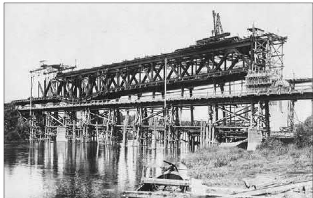
Het spoorwegviaduct met bouwbrug.