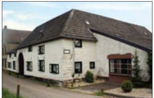
De Witte Keizerin