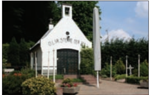
Kapel Onze Lieve Vrouw Sterre der Zee